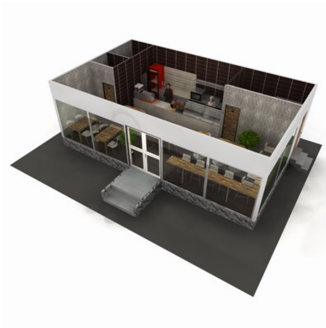
Проект коно пицца кафе, внешний вид торговой палатки