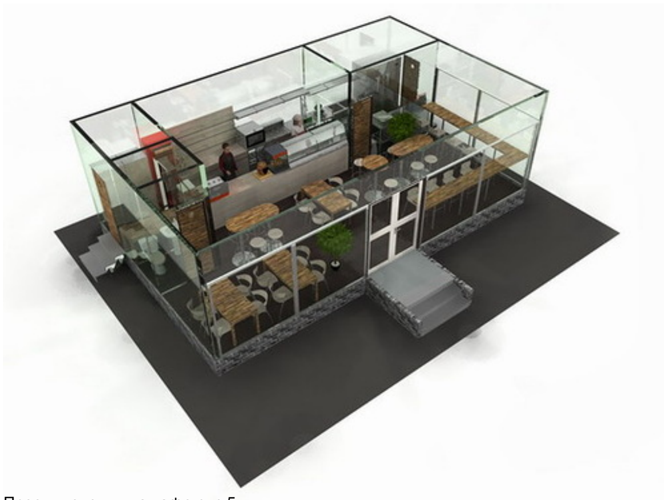
Проект коно пицца кафе рис.5