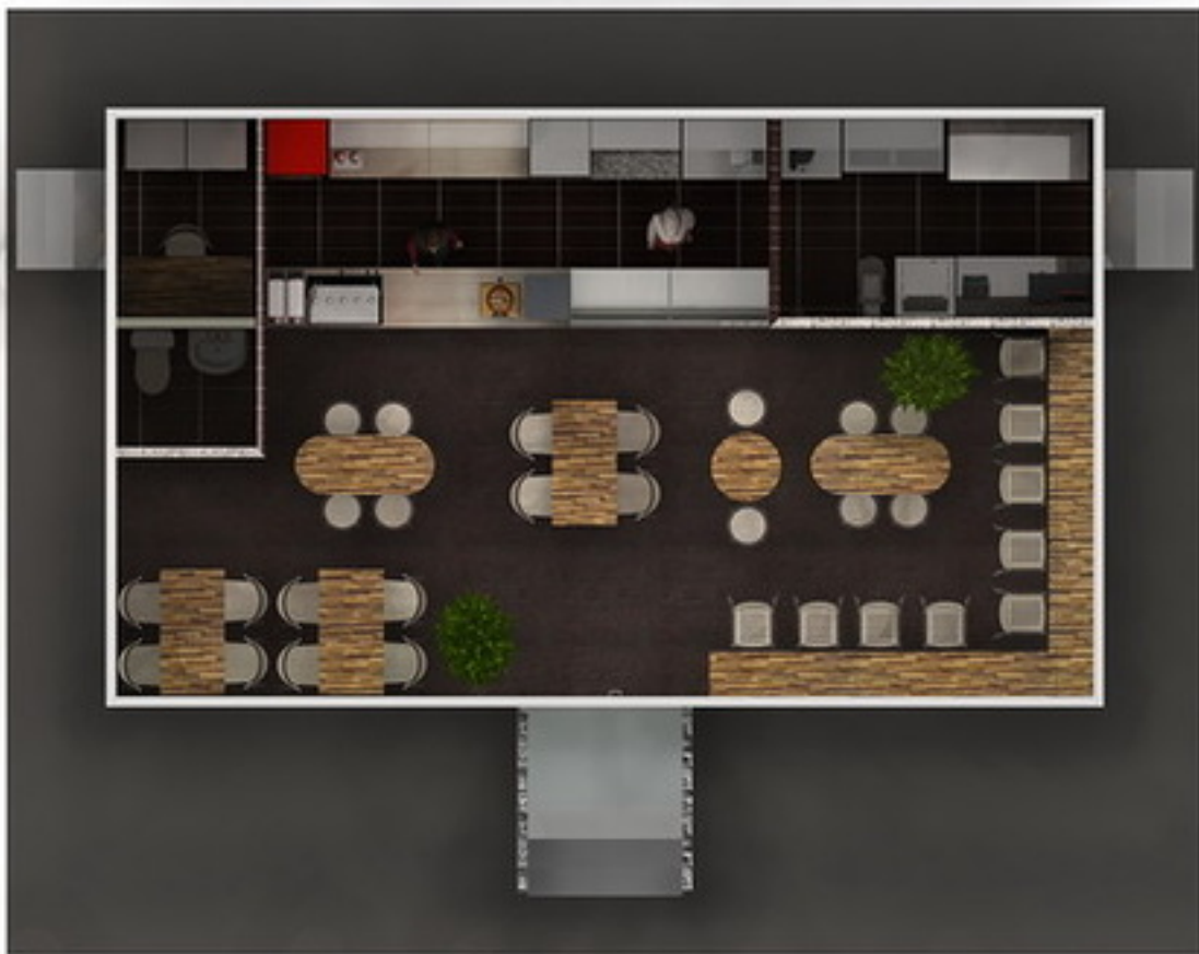
Проект коно пицца кафе рис.3