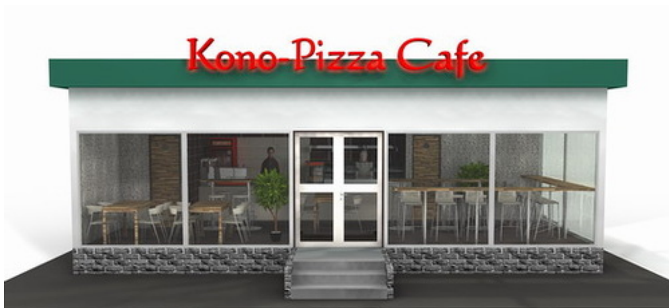
Проект коно пицца кафе рис.1