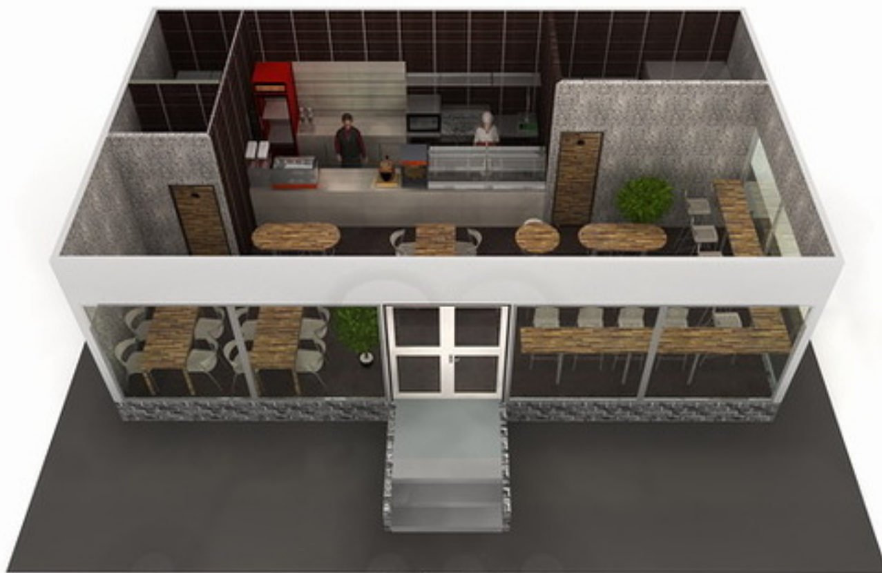
Проект коно пицца кафе рис.2